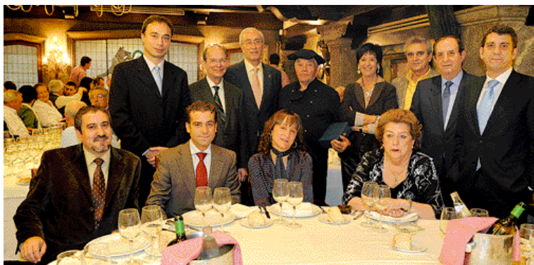
Hubo nutrida representación municipal en la tradicional comida organizada por el Hogar Leonés