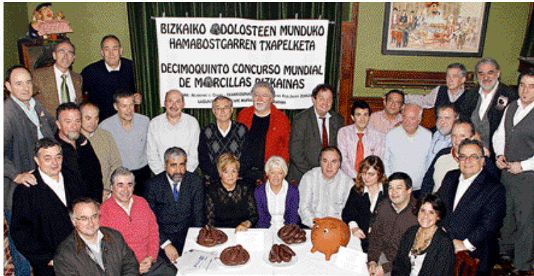
El ganador de la XV edición del Concurso Mundial de Morcillas fue la carnicería Alberdi de Durango